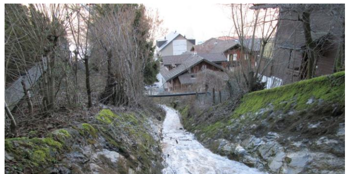
Bauzone: Priorität beim Hochwasserschutz

Die Lage der Gewässerräume wird im neuen Zonenplan 3 festgelegt und Nutzungsbeschränkungen im Baureglement festgeschrieben. Vielerorts ändert sich nichts, da die Übergangsbestimmungen des Bundes bereits für deutlich grössere Gewässerabstände gesorgt haben.