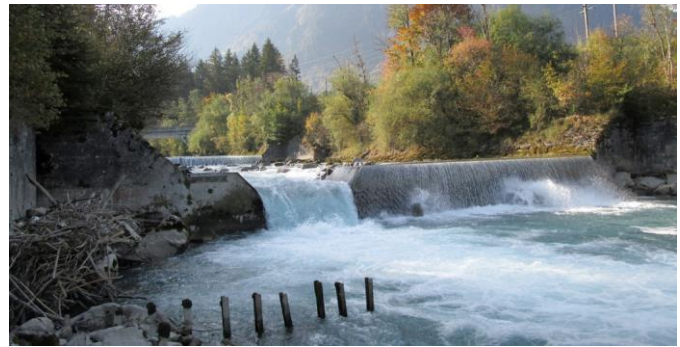
Sonderfall Kander, Richtplan gibt Gewässerraum vor

Die Festlegung der Gewässerräume in der baurechtlichen Grundordnung liegt bis zum 6. Juli 2026 zur öffentlichen Einsichtnahme auf (öffentliche Planauflage).