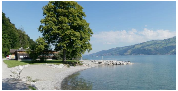
Regelfall Seeufer 15 m, Besitzstandsgarantie