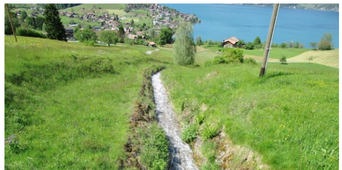
Landwirtschaftszone: Priorität bei Lebensraum und Artenvielfalt