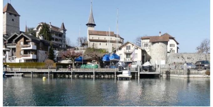
Ausnahme im dichten Siedlungsgebiet: 5.40 m