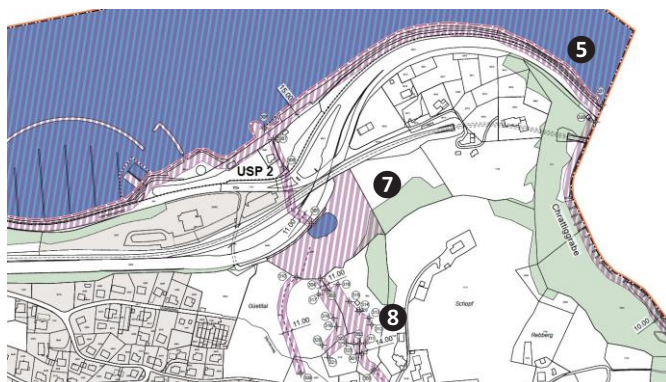
Ausschnitte Zonenplan 3 Faulensee