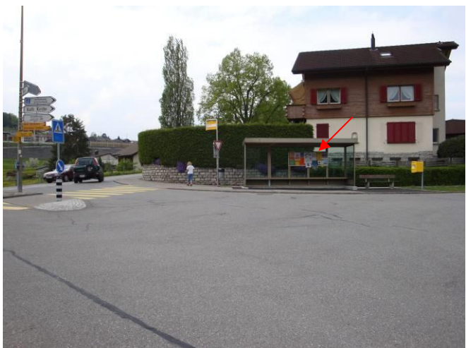
Bürg, in Bushaltestelle Einsmündung Schachenstrasse