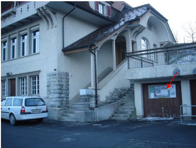
Aeschstrasse, an Garagentor beim Schulhaus