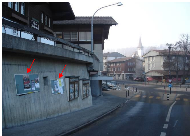
Seestrasse, Kronenplatz, an Stützmauer