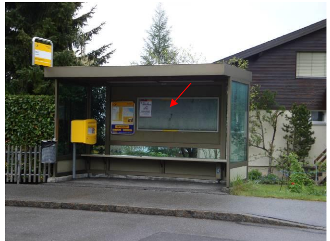
Hondrich, in Bushaltestelle Stutz (Moos)