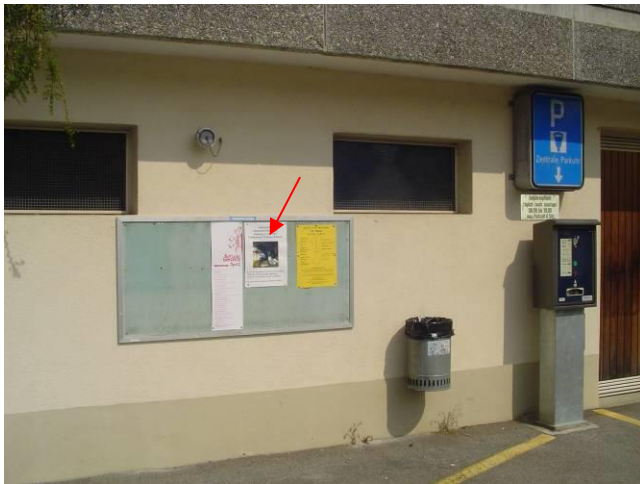
Gebäude Pumpwerk Parkplatz Dorf (Tenne)