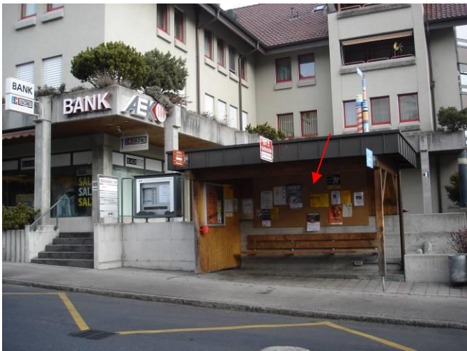
Oberlandstrasse 9, vor AEK in Bushaltestelle