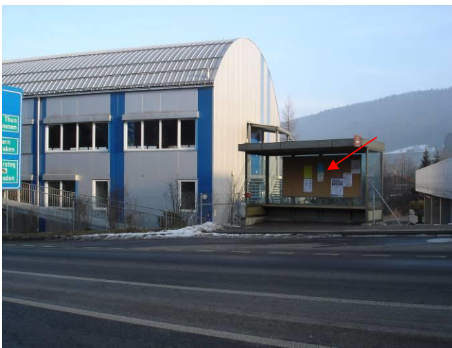
Simmentalstrasse, in Bushaltestelle unterhalb Passarelle