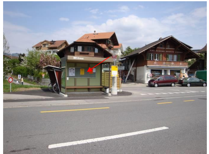
Thunstrasse, in Bushaltestelle Einmündung Werkstrasse