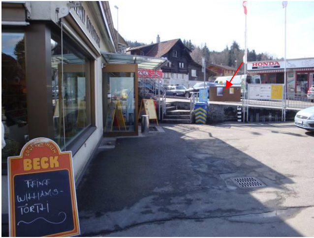
Spiezstrasse, bei Bäckerei Linder im Gwatt