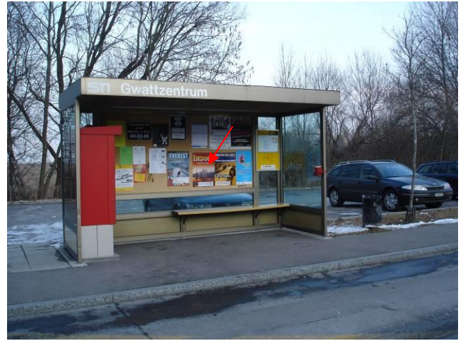
Spiezstrasse, in Bushaltestelle Deltapark (seeseitig)