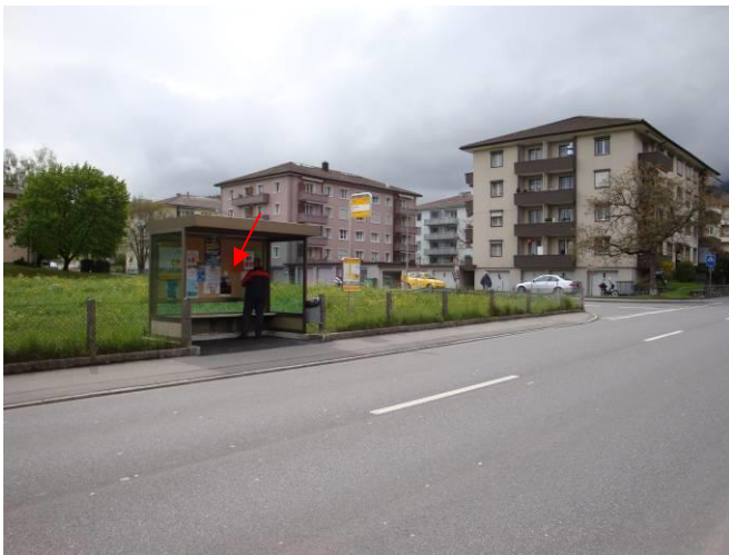
Simmentalstrasse, in Bushaltestelle Neumatte