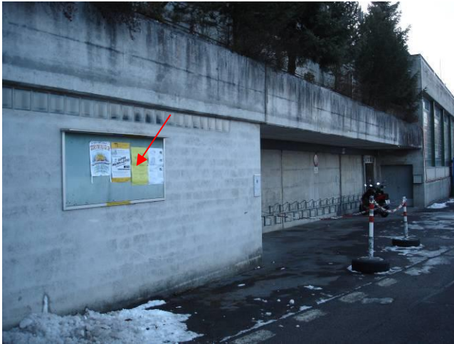
Höhenstrasse, an Mauer beim Schulhaus Roggern