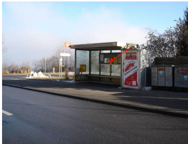
Krattigstrasse, in Bushaltestelle, Einsmündung Aeschiweg