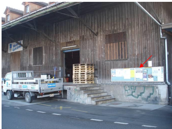
Bahnhofstrasse 6, Brennstoffe/ Getränke Rubin AG