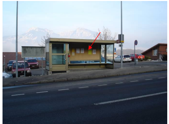
Frutigenstrasse, in Bushaltestelle Restaurant Rössli