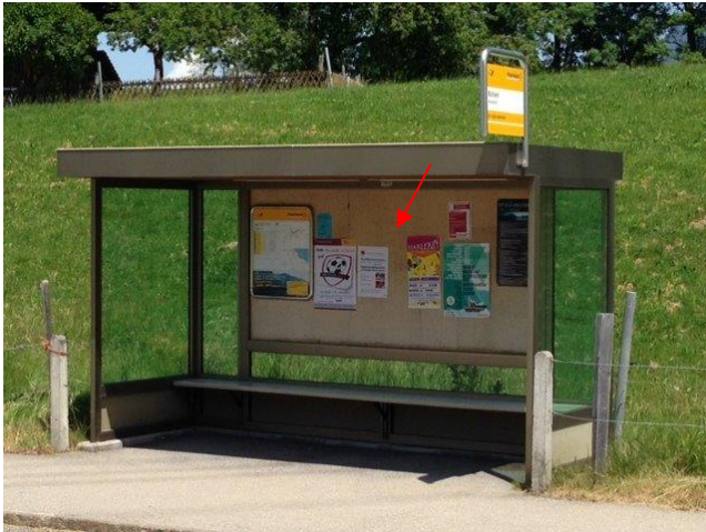
Aeschstrasse in Bushaltestelle Bühlen