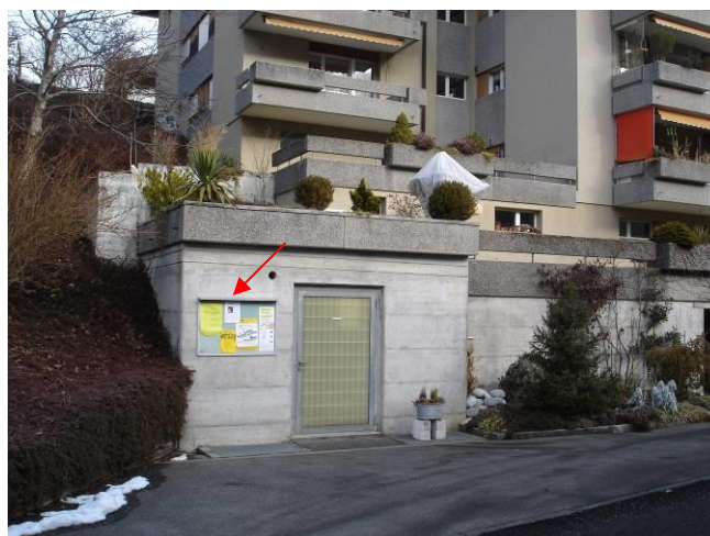
Bürgstrasse Nr. 23, an Trafostation