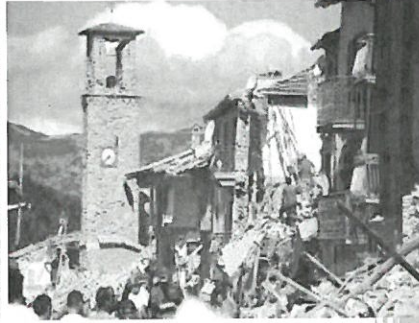
Arquata del Tronto