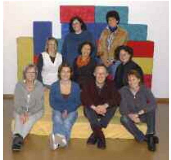
Teamarbeit wird bei uns gross geschrieben.

Das Ziel der logopädischen Behandlung ist eine verbesserte Kommunikationsfähigkeit des sprachauffälligen Kindes und nicht das Erreichen einer Idealnorm. Das Kind erhält die Möglichkeit, Entwicklungsrückstände nachzuholen. Dies geschieht nach einem individuell geplanten Vorgehen unter Einbezug von Erfahrungen in allen Wahrnehmungsbereichen (Spüren, Hören, Sehen), im Spiel und in der Bewegung. So kann das Kind seine sprachlichen Fähigkeiten ausbauen und verbessern.