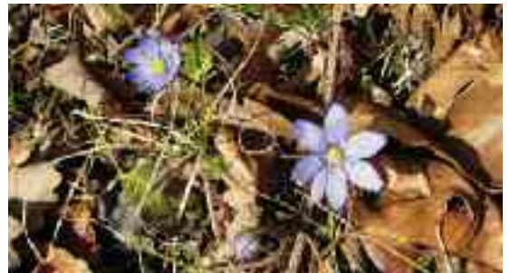
Frühlingsboten im Rustwald