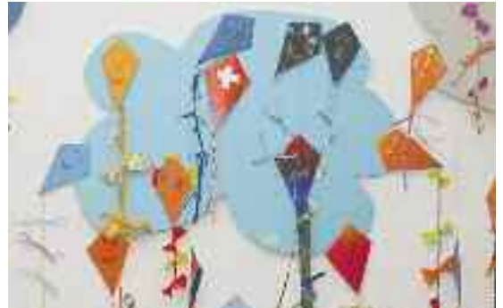
Eine der therapeutischen Arbeiten, welche von Schülerinnen und Schülern anlässlich des Psychomotorik- oder Logopädieunterrichts gefertigt wurden.

Heilpädagogische Dienste Spiez-Aeschi-Krattigen Sodmattweg 5 3700 Spiez