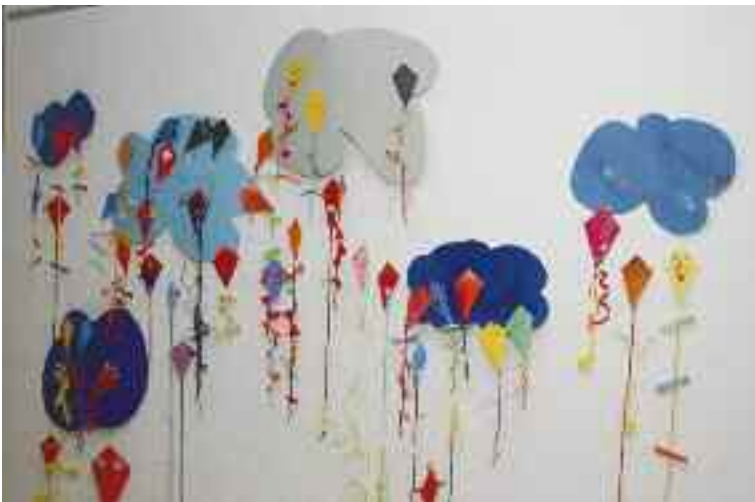
Therapeutische Arbeiten, welche von Schülerinnen und Schülern anlässlich des Psychomotorik- oder Logopädieunterrichts gefertigt wurden.

Die Speziallehrkraft arbeitet in Gruppen- oder Einzelunterricht im Schulhaus, während der Unterrichtszeit. Der Spezialunterricht erfolgt in rollender Planung und wird mit dem ordentlichen Unterricht vernetzt. Zusammenarbeit mit allen beteiligten Personen sowie eine ressourcenorientierte Förderung sind wichtige Grundsätze.