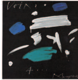
Rudolf Mumprecht voir , 2004, Acryl 60 x 60 cm Copyright by Prolitteris Zürich