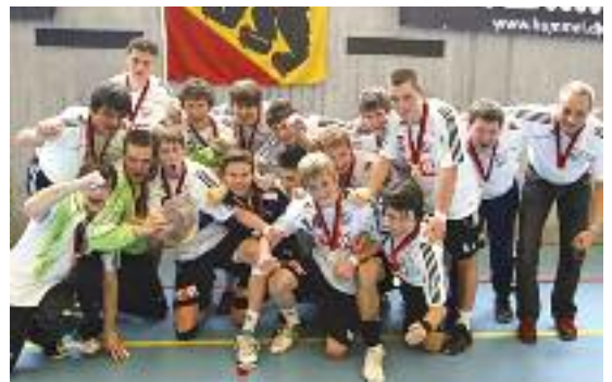
Berner Cupsieg 2010

Meine Begeisterung für den Ballsport war sofort geweckt und nach einem weiteren Jahr wechselte ich definitiv von der Leichtathletik zum Handball. Bis heute bin ich überzeugt, dass mir ein Mannschaftssport besser gefällt. Mit meinen Kollegen zusammen Erfolg zu haben, macht mehr Freude. Wir gewinnen zusammen und wir verlieren zusammen!