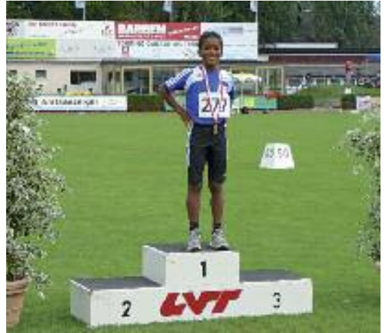
Zuoberst ist's am schönsten: 1. Platz bei den kantonalen Einzelmeisterschaften 2008 über 50 Meter Sprint.

Bis jetzt ging es fast immer einigermassen. Allerdings sah ich im letzten Herbst keinen anderen