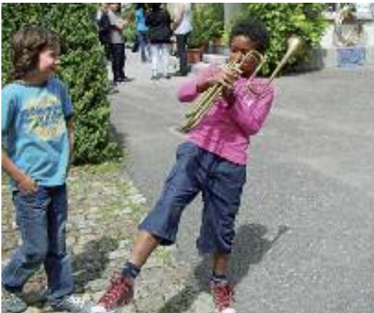
Solo auf einer selbst geschweissten Fantasiertrompete am Blechmusiktag der Musikschule.

Weg, als aus der Jugendmusik Spiez auszutreten, weil die Proben genau an den gleichen Abenden waren wie meine Trainings. Dafür kann ich jetzt an der Musikschule im Orchester mitmachen. Das gefällt mir auch sehr gut.