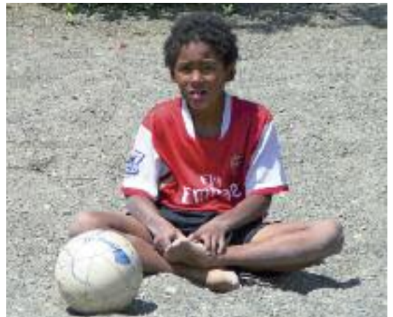
Jumu spielt seit letztem Herbst im FC Spiez Fussball.