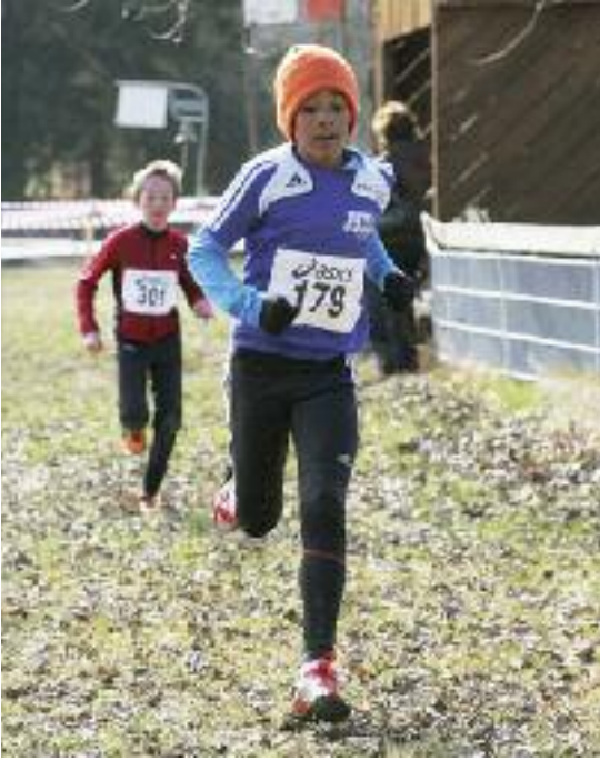
Unterwegs zum 2. Rang an den Kant. Crossmeisterschaften 2010.