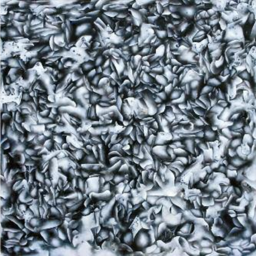
VATALIA, 2004, Oel auf Baumwolle, 120x120 cm

Als einem Chronisten der Zwischentöne geht es ihm um die Dokumentation des Flüchtigen. Es sind dies Einzelheiten, so zart und unscheinbar, dass sie bei der gewöhnlichen Betrachtung kaum wahrgenommen werden. Haag macht die Monumentalität des Mikrokosmos sichtbar. Es scheint beinahe eine homöopathische Strategie zu sein, die hinter diesen Tuschearbeiten liegt.