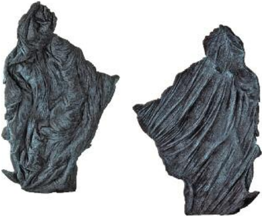
CAROSUT, 2005, Bronze, 23x16x4.5 cm

Und obwohl man sich an Gallé-Vasen, geologische Strukturen, mikroskopische Feinheiten, an chinesisches Feuerwerk, an romantische Sonnenuntergänge, an schwebende Quallen oder fluktuierende Spermien erinnert fühlt, ist Filip Haag kein antiquierter Träumer. Er ist vielmehr einer dieser forschenden Künstler, die ihr Atelier in eine explosive Küche – der Begriff stammt übrigens von Bernhard Luginbühl, auch einer dieser Verwegenen – verwandelt haben, um dort täglich