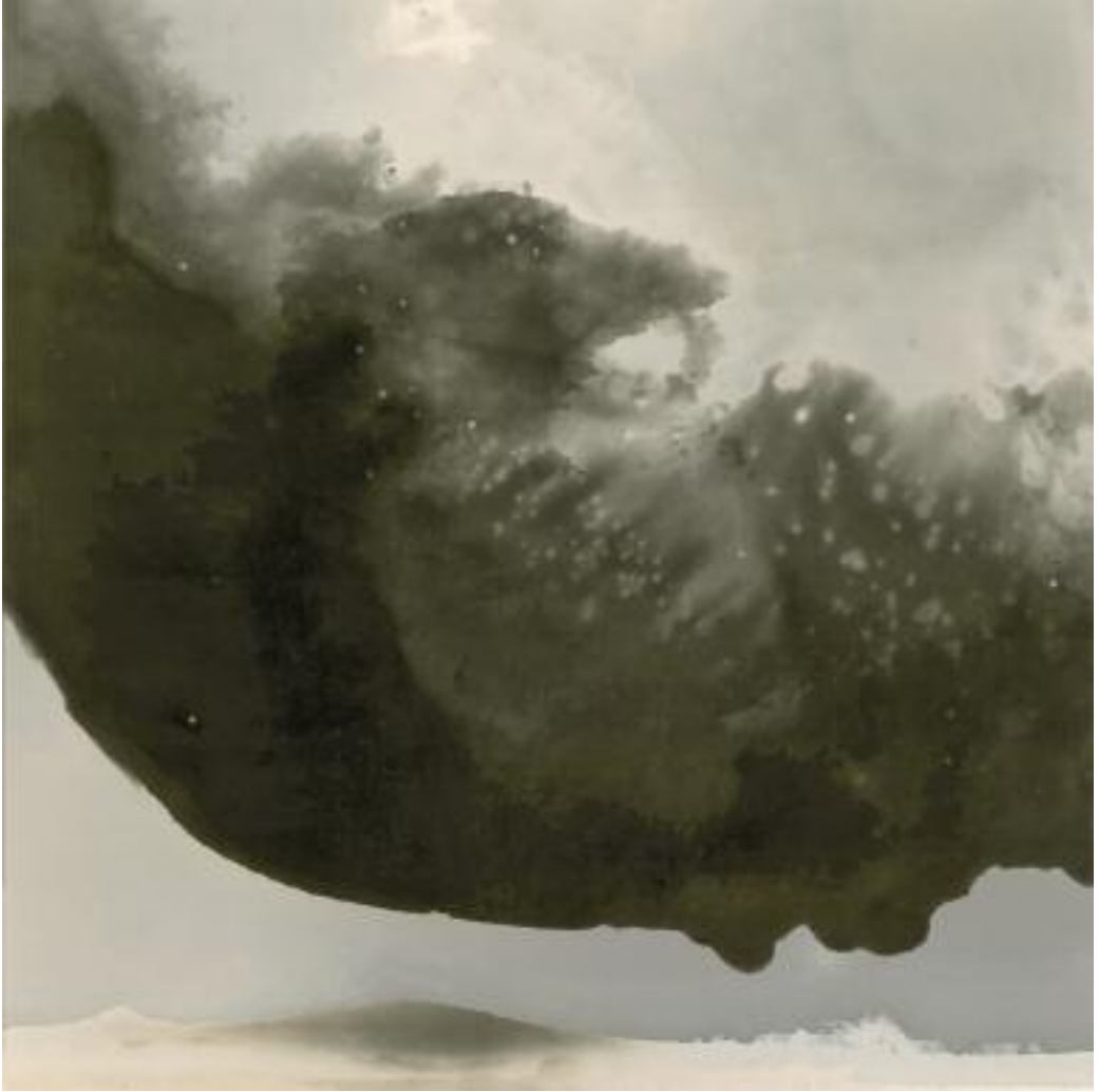
INJECTION 10, 2007, fotochemische Malerei/Pigment print, 60x60 cm

Einige Landschaftsbilder zeigen derart effektvolle Spektren des Lichtes und der Farben, dass wir uns in einem Kosmos fern von der Erde aufzuhalten glauben. Doch all dies sind Assoziationen, mit denen uns Filip Haag in Räume lockt, deren eigentliche Kraft sich in der Imagination