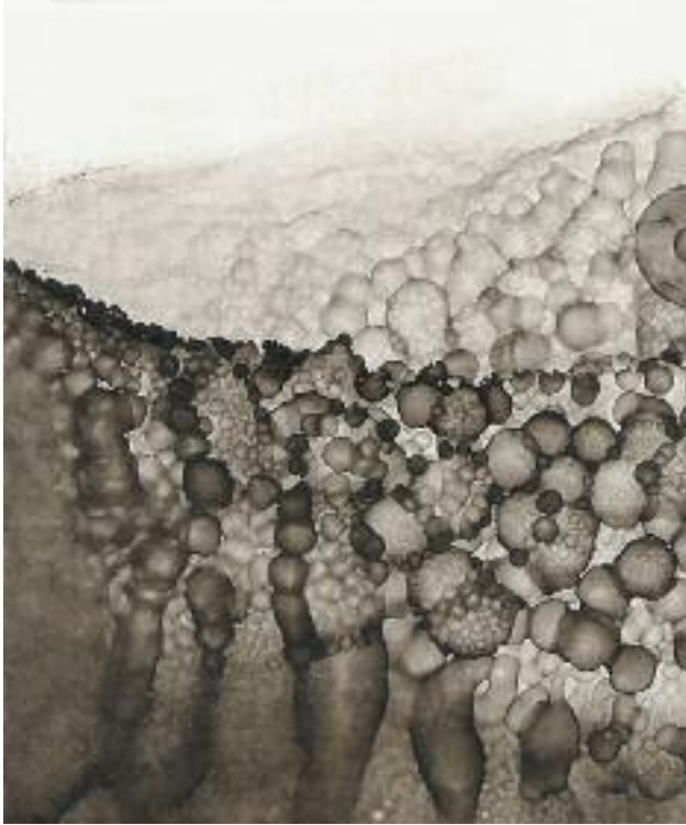
Ohne Titel, 2002, Tusche auf Karton, 4.3x3.7 cm

Auch neuere naturwissenschaftliche Erkenntnisse im Anschluss an Albert Einsteins «Relativitätstheorie» belegen die Anschauung, dass die Materie, bevor sie definitiv Gestalt annimmt, in einem Prozess des Hervorbringens befangen ist, der sich erst auf der letzten Stufe zum Bild der Wirklichkeit klärt. Was wir für feste Stoffe halten, sind in Wahrheit bewegte Kräfte und Gegenkräfte, Partikel, verwickelt in komplizierte prozessuale Abläufe. Als spurensuchender Künstler ist er Ästhet und Demiurg im einen. Er reflektiert fundamentale Dinge. Weltschöpfung und Kunstschöpfung sind von dem gleichen Atem beseelt. Der Künstler lehrt den Betrachter, das Formlose um seiner selbst willen zu würdigen – statt durch das Bild auf die Welt blicken zu wollen, soll er darin ein Spiegelbild seiner eigenen condition