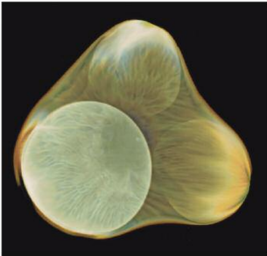
INJECTION 126, 2007, fotochemische Malerei/Pigment print, 60x62 cm

«Du zählst Haag also nicht mit?» «Nein, er musste zufällig dran glauben.»